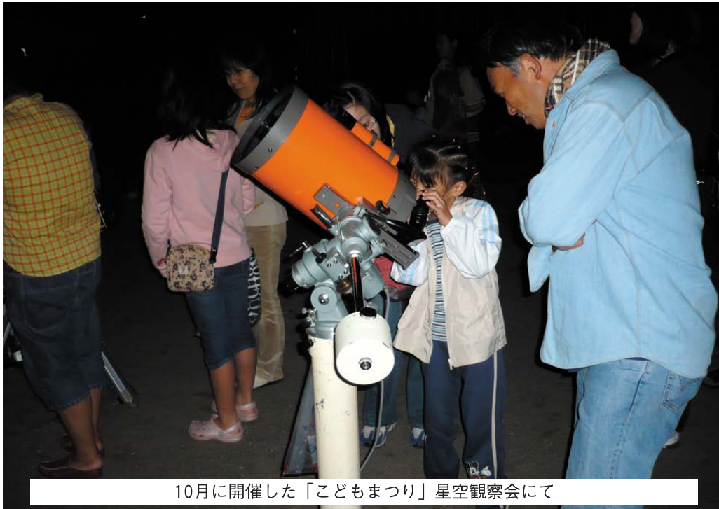
10月に開催した「こどもまつり」星空観察会にて