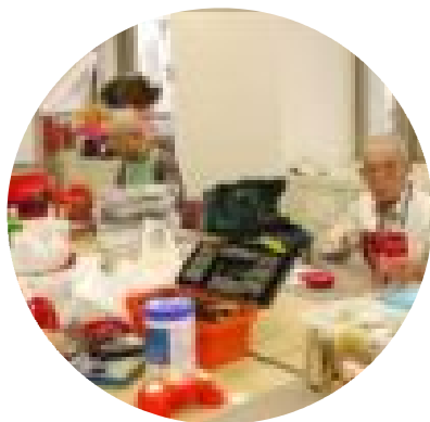
おもちゃ病院修理中