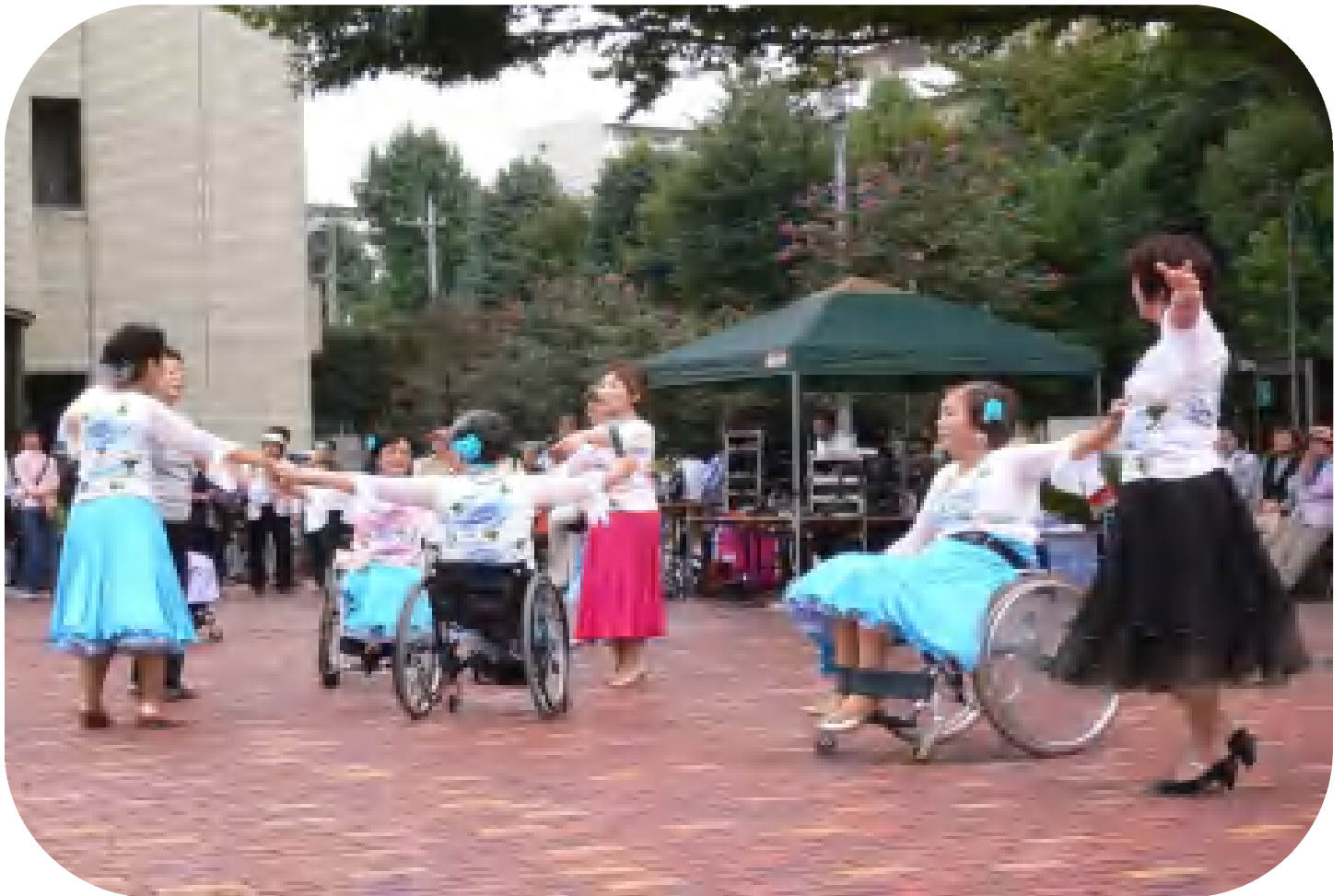
車いすダンス (いきいき健康フェスティバルにて)

【発行】昭島ボランティアセンター【編集】昭島ボランティアセンター運営委員会ボランティア情報誌編集部