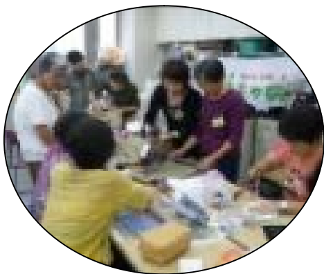
ありんこ教室 ボランティア活躍中