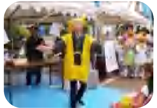
いきいき健康フェスティバルにて

講座 どんなサポートが必要なの？ ~ 消費者被害にあわないために ~ サロン 花・華クラブ イベント 講談 成年後見制度 住みなれたまちで自分らしく安心して暮らすために