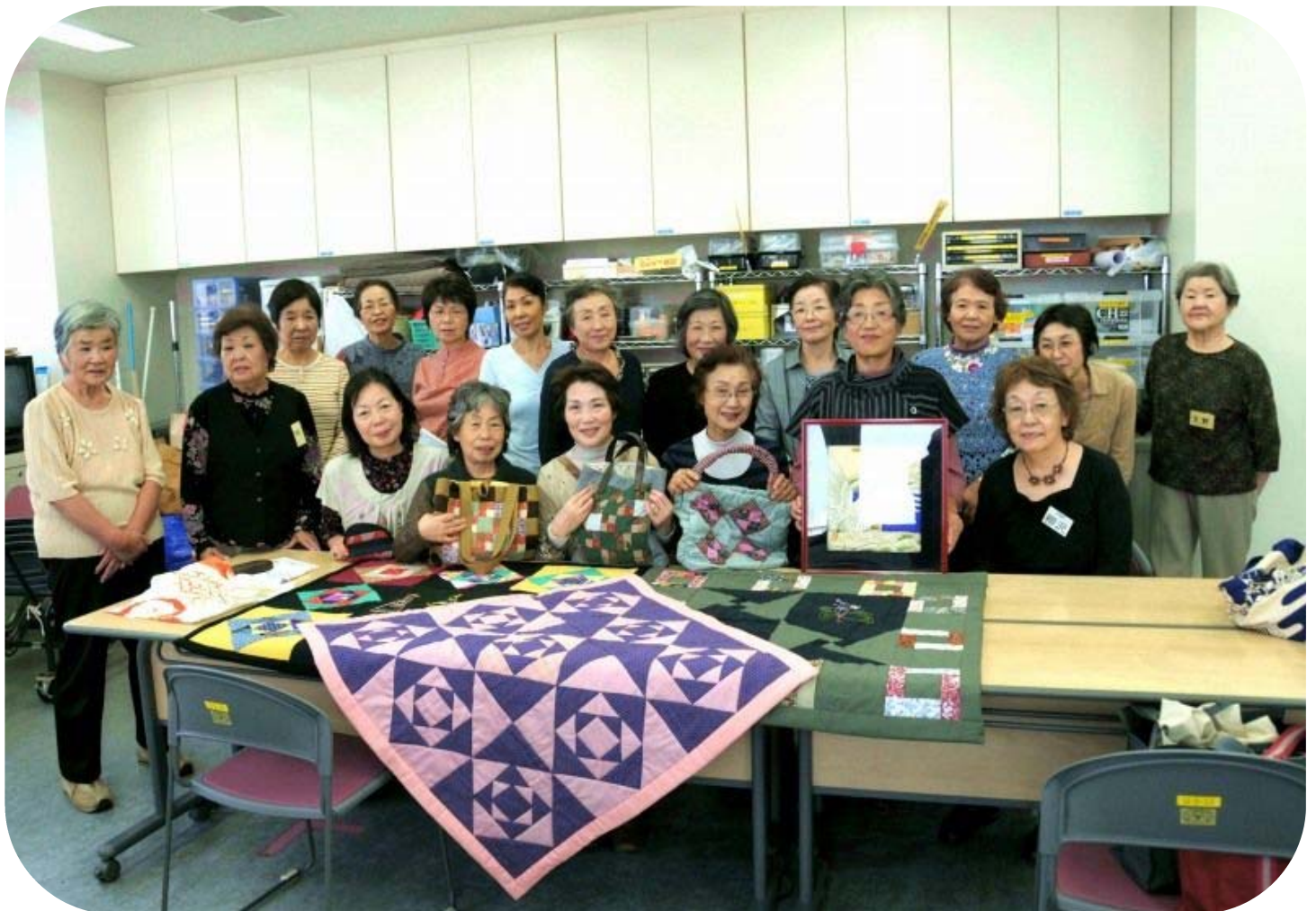
ありんこ教室 手芸教室にて

【発行】昭島ボランティアセンター【編集】昭島ボランティアセンター運営委員会ボランティア情報誌編集部