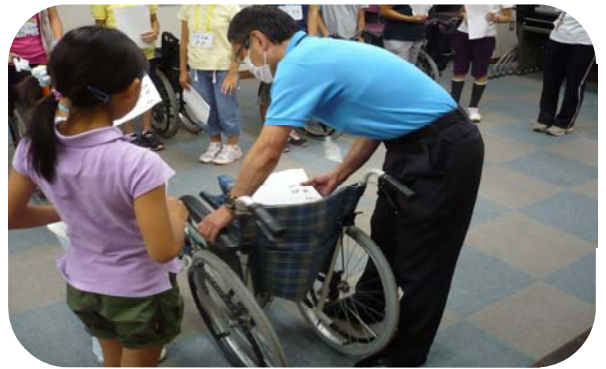
小学校ボランティア部 車いす体験中