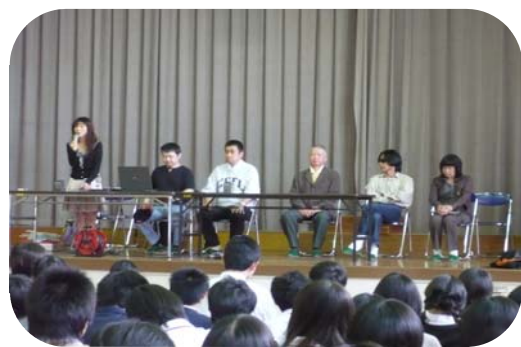
中学校学習支援 ぷらっとさん