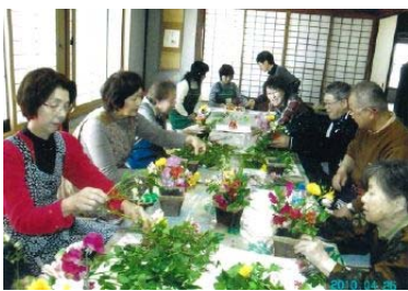
「春の寄せ植え」 居酒屋2階にて

どちらかと言うと、万事消極的な私ですが、園芸のボランティアに限らず、これからも自分のことができることをやっていたければなあと願っています。