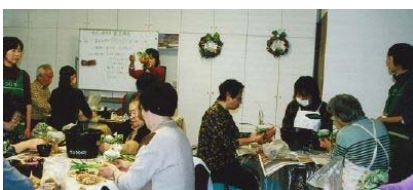
「手作りのクリスマスリース」 介護施設にて