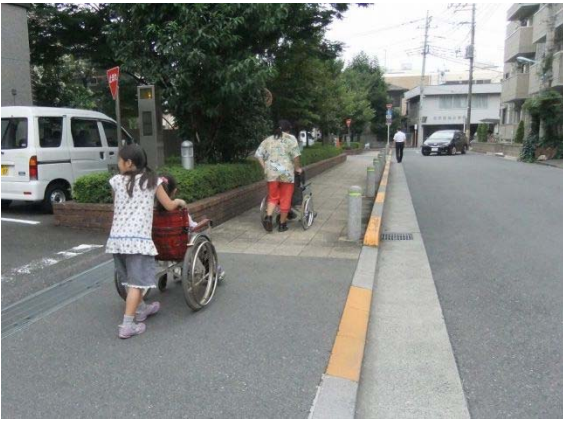
車いすで屋外にでました

この同じ日、午後2時30分より、光華小学校ボランティアクラブの車いすの扱い方の体験が「あいぼっく」で行われ