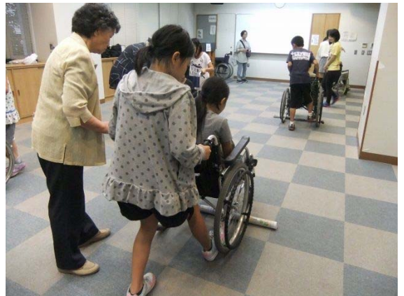
車いすで障害物を超える