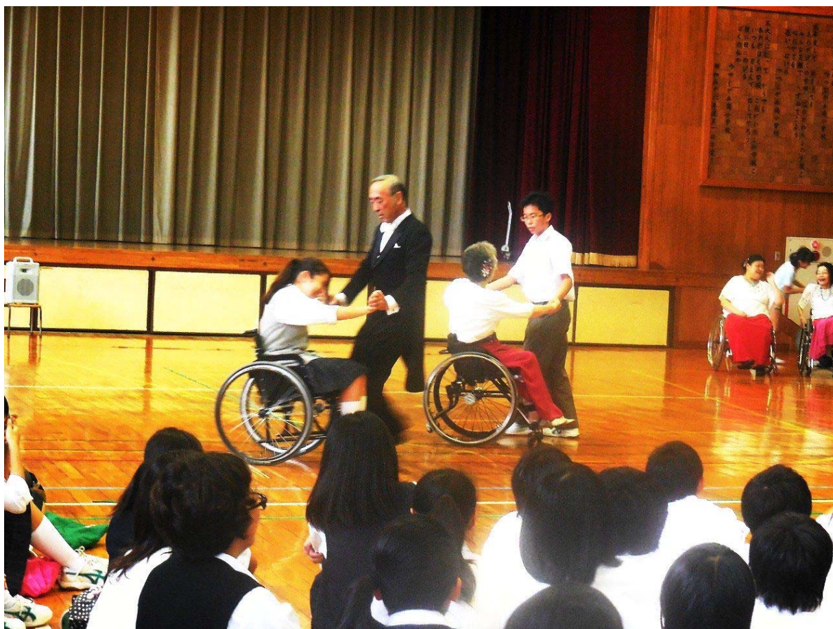
車椅子とのふれあい学習の様子