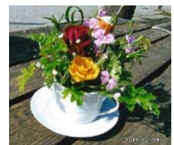
「カップアールグレイ」 デイサービスにて