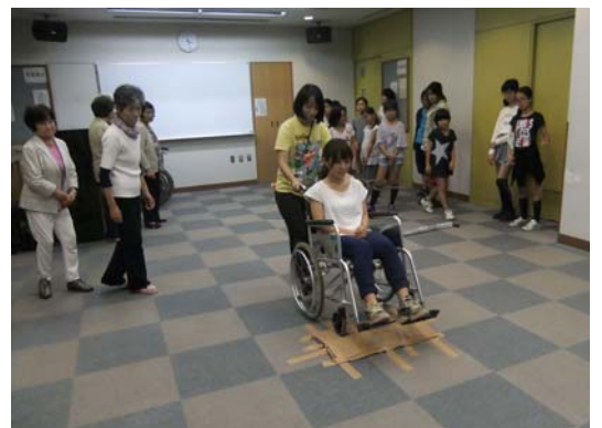
車いすで大きな障害物を超える

参加した4年生から6年生までの12名の生徒たちも、最初はおそろおそろでしたが、建物の外に出て一般道路を一周するあたりから、だんだん慣れてきて少し余裕が出てきたようでした。一時間ほ