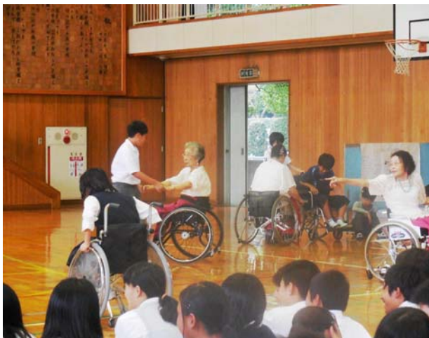
車いすダンス体験