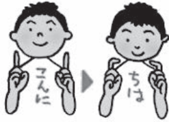
おほえおほいお得な手話