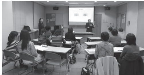
平成26年度手話教室の様子