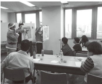
12月18日に実施した交流会

イオンリテール株式会社ザ・ビッグ昭島店様より、あきしま福祉作業所へ物品寄付を頂き、交流会にも参加して頂きました。心より感謝申し上げます。