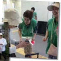
上ノ原保育園の園児さん

昨年の10月～12月に行われた共同募金では市民の皆様、自治会、赤十字奉仕団、民生・児童委員、団体や事業所の皆様に多大なご協力をいただきありがとうございました。皆様からの募金は、東京都共同募金会に送金しました。このうち、赤い羽根は地域の福祉施設や福祉活動に活用されます。歳末たすけあい運動は昭島市社会福祉協議会に配分され、地域福祉活動費として活用されます。