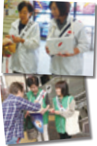
10月に民生・児童委員、赤十字奉仕団の皆さんによって行われた街頭募金

昨年の 10 月～ 12 月に行われた共同募金では市民の皆様、自治会、赤十字奉仕団、民生・児童委員、団体や事業所の皆様に多大なご協力をいただきありがとうございました。皆様からの募金は、東京都共同募金会に送金いたしました。このうち、赤い羽根共同募金は地域の福祉施設や福祉活動に活用されます。歳末たすけあい募金は昭島市社会福祉協議会に配分され、地域福祉活動費として活用いたします。