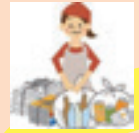
在宅福祉サービスに (くじらほっとサービス)

そのうち、歳末たすけあい募金で社会福祉協議会に配分された地域福祉活動費の使い道の一部をご紹介します。