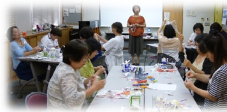
昨年度の懇談会写真

利用会員からのキャンセルは、協力会員に直接連絡が欲しい。(早く知りたい) とのご意見をいただきました。平成31年4月～キャンセルの連絡は、利用会員が直接協力会員と外に連絡をしていただく方法に変更を考えています。その意見も是非聞かせていただきたいです。