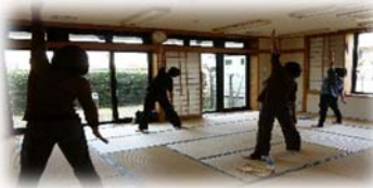
最終日のヨガ写真

*協力会員さんが立ち上げた、「さーくる オズ」「さーくる ボク」のチラシも同封してありますので是非ご参加ください。「さーくる ボク」は、高和先生が講師です。